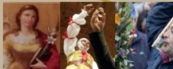
Leggenda di Santa Giusta

Nei millenni il Vernaccia è sempre stato presente in quasi tutte le case nell'areale di produzione, entrando a far parte di riti, tradizioni e leggende.